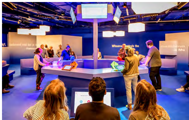
Nieuws of Nonsens

Het thema van 2018 betrof 'Is de krant nog een meneer?' (herziene BIS aanvraag Persmuseum). Er zijn twee mini-expos gemaakt. In februari is in samenwerking met dagblad Trouw een presentatie 75 jaar Trouw aan de waarheid gerealiseerd. Deze tentoonstelling is getoond op de jubileumbijeenkomst in de drukkerij van de Persgroep op 18 februari 2018. En van 28 april t/m 13 mei in Beeld en Geluid. In november is de mini-expo 400 jaar bij de tijd , over 400 jaar krant in Nederland, te zien geweest. Deze presentatie